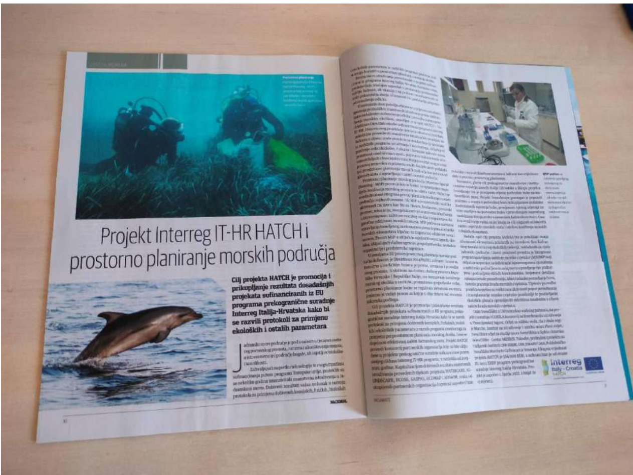
Figure 1. Article in MegaWatt Journal

The same prepared text and photos were sent to “Hrvatska vodoprivreda” journal of Hrvatske Vode, which published the article in their July 2023 issue (Annex below). This journal covers the topics of freshwater and seawater economics and conservation, making their readers relevant target group for the topic of MSP and HATCH project.