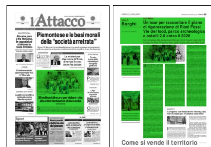
Come si vende il territorio

Sono solo alcune delle operazioni che - grazie al maxi finanziamento di 20 mln di euro riconosciuto dal Ministero della Cultura ad Accadia, regina pugliese (insieme ad altri 19 comuni italiani) del Bando Borghi Linea A del Pnrr - consegneranno ad un volto nuovo, entro il 2026, Rione Fossi, suggestivo nucleo originario del paese dauno che affonda le sue radici nel neolitico e in cui da oltre mezzo secolo risiede una ghost town, dopo l'abbandono dei residenti dell'antico quartiere a seguito del terremoto del 1962. Quel borgo medievale, sorto su una molteplicità di grotte dalle rovine dell'antica Accua (fondata nel 800 a.c. dai Dardani e centro di pratiche divinatorie), conserva ancora 14 ipogei di epoca pre-romana dal fascino mistico, grazie agli eremiti che vi abitarono nel corso dei secoli. Rione Fossi fu anche teatro degli scontri