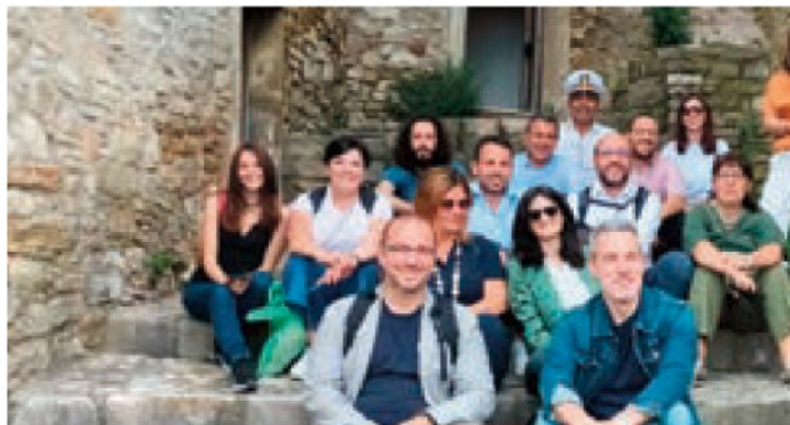
La delegazione del press tour