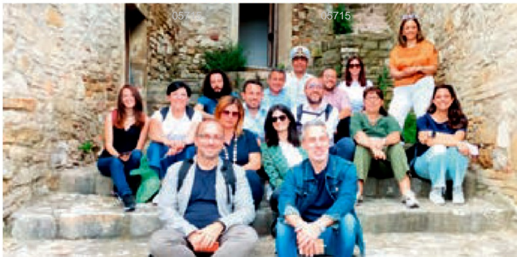
Il tour nel Rione Fossi