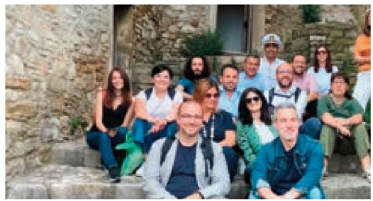
La delegazione del press tour