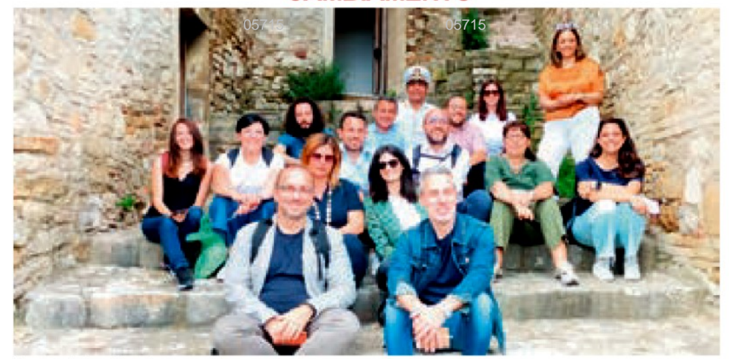
Il tour nel Rione Fossi