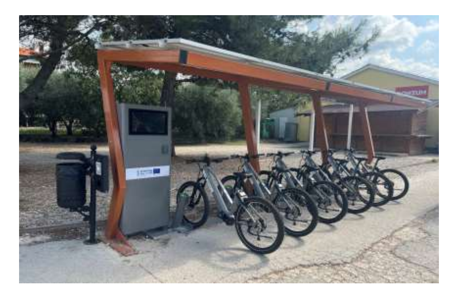
6 electric bicycles at the charging station — Salvela — city of Vodnjan