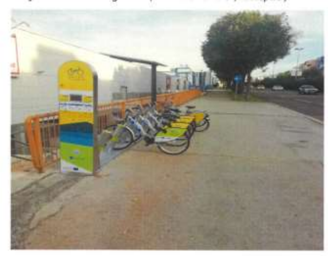
"Stobreč - centar "( kat.čest 1661/1, k.o. Stobreč)

"Ravne Njive - Domovinskog rata" ( kat.čest.2522/3 , k.o.Split )