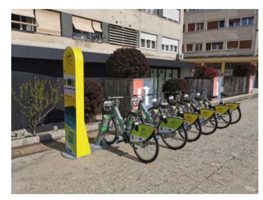
Municipality of Klis