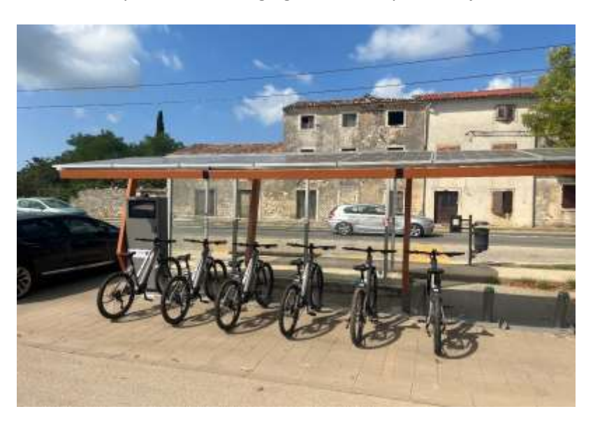
6 electric bicycles at the charging station – Galižana

6 electric bicycles at the charging station - city of Vodnjan