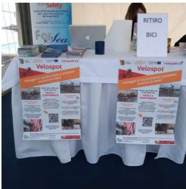
Foto: punto informativo Progetto SUTRA e punto noleggio bici