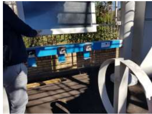
The Ecomobility point at near the Hospital (VIA RIGOPIANO)