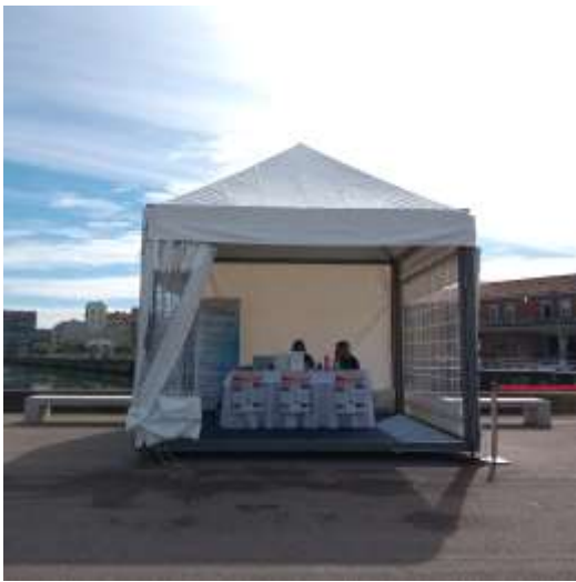
Foto: stand del progetto SUTRA dove è stato possibile noleggiare le bici

The event was mainly attended by citizens, adults and younger people, interested in the initiative.