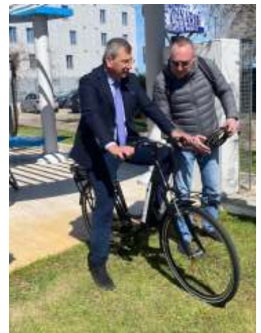
The inauguration of the Ecomobility point of the Touristic Port with some of the e-bike purchased with the project