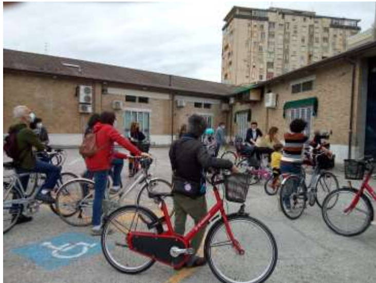
Foto: pubblico presente all'iniziativa di inaugurazione