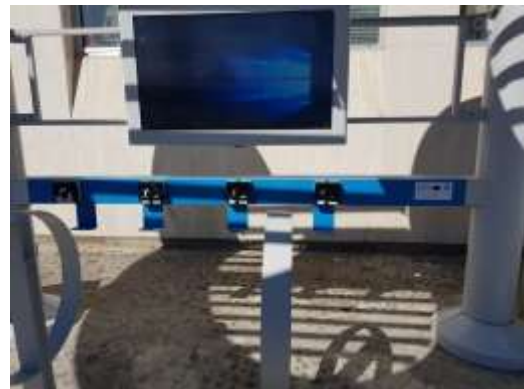
The Ecomobility point at the Airport (AEROPORTO d'ABRUZZO)