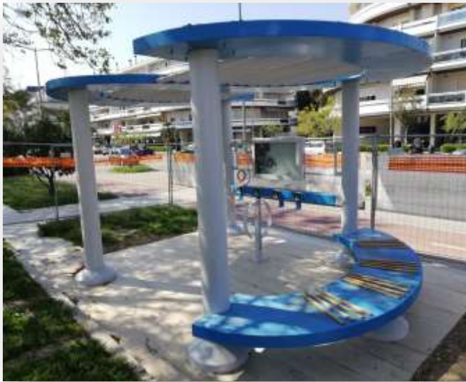
The Ecomobility point of the Touristic Port (LUNGOMARE PAPA GIOVANNI XXIII)