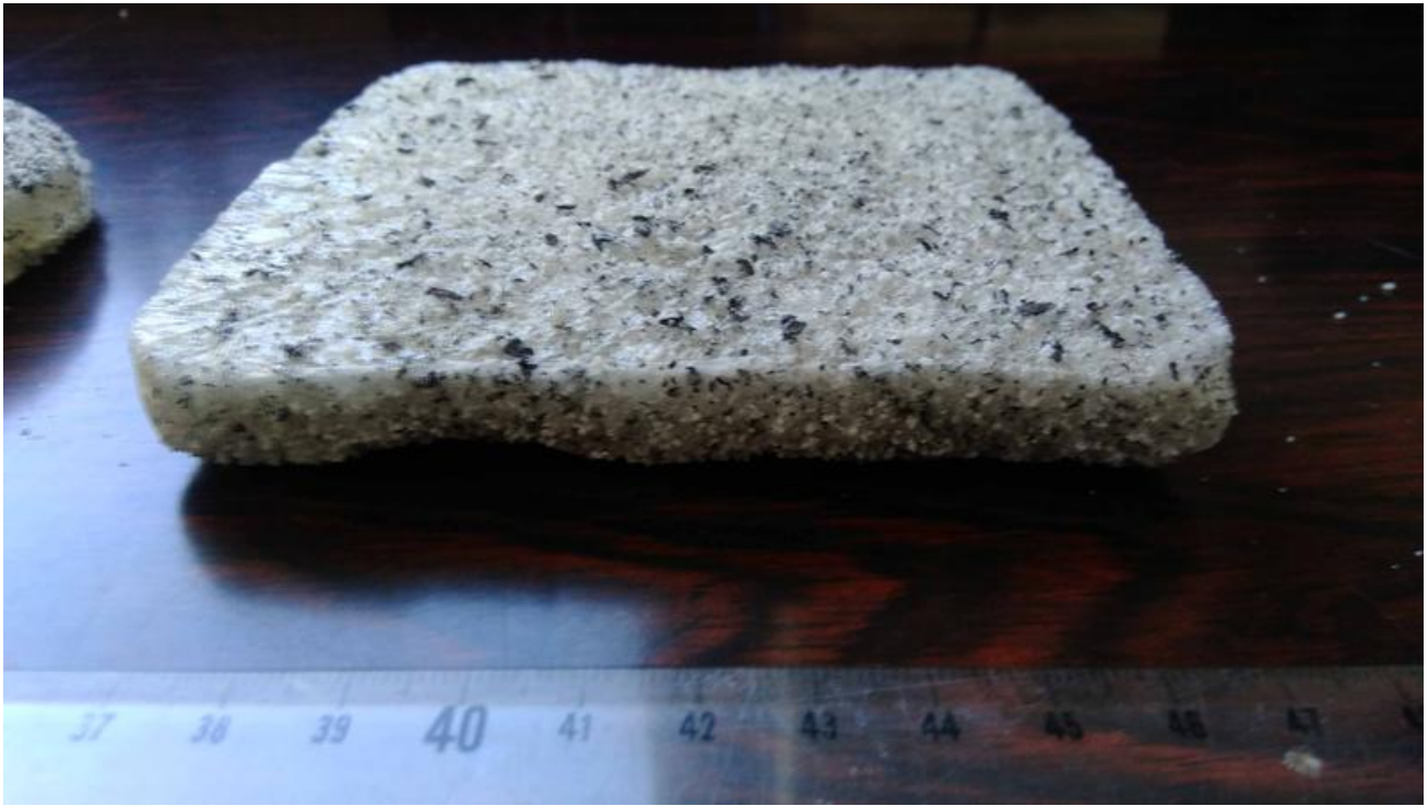
So sieht das recycelte Material aus.