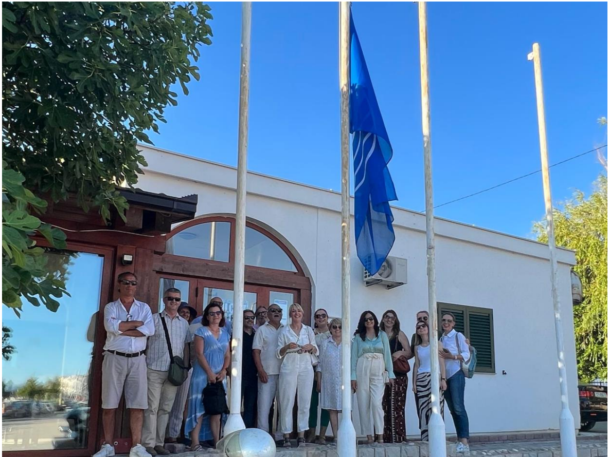
The Blue Flag in Marina Strožanac