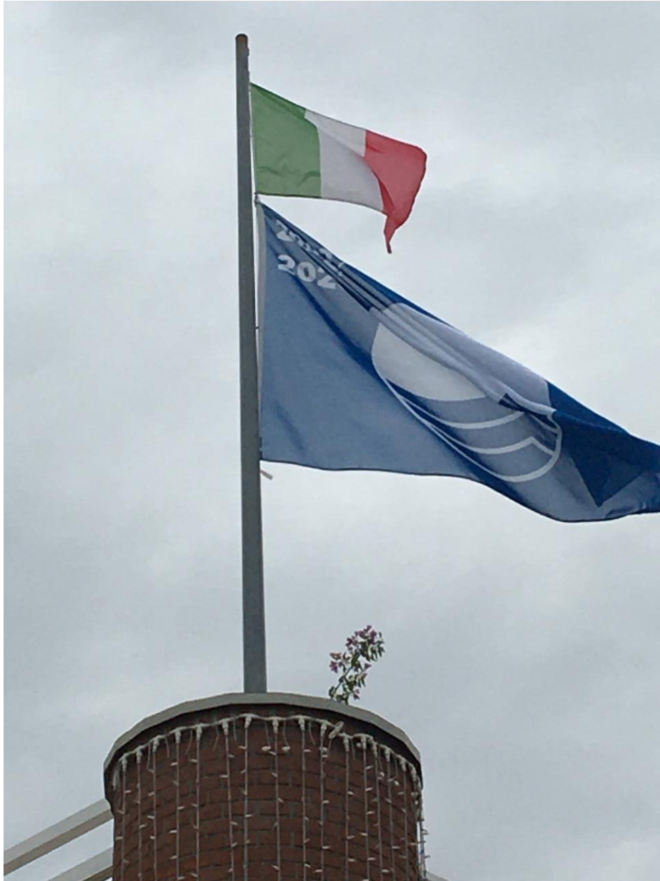
The Blue Flag in Marina Portobaseleghe