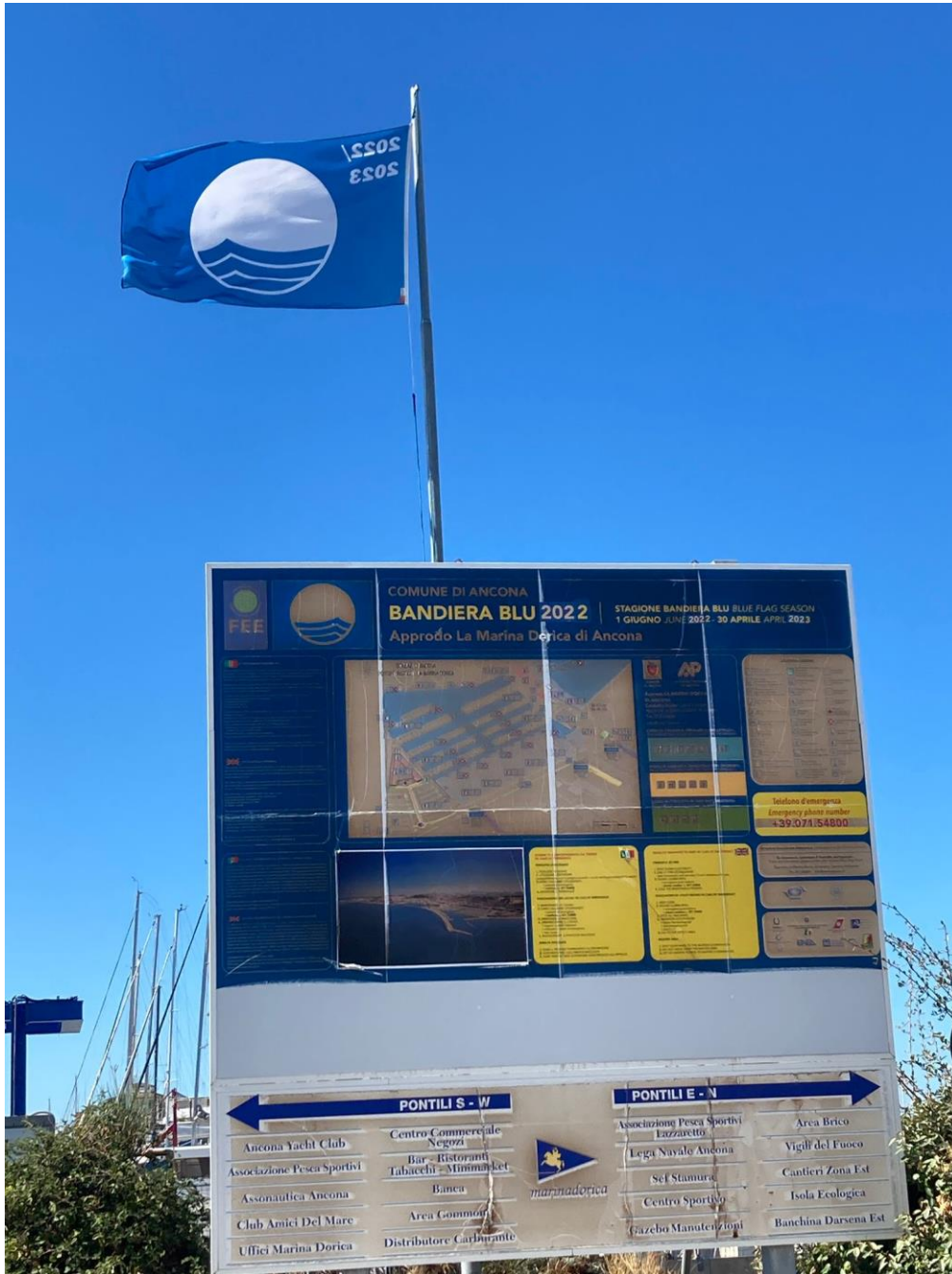
The Blue Flag in Marina Dorica