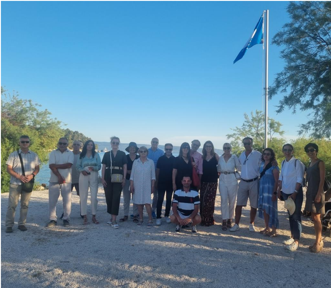
The Blue Flag at Strožanac beach