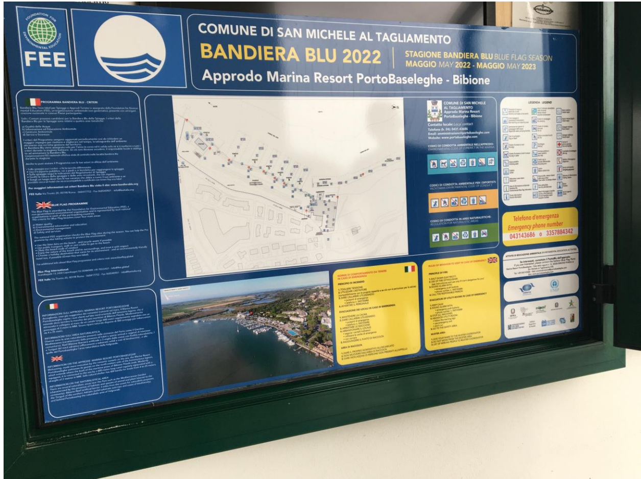
The Blue Flag information board