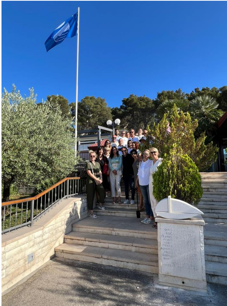
The Blue Flag in Marina Špinut