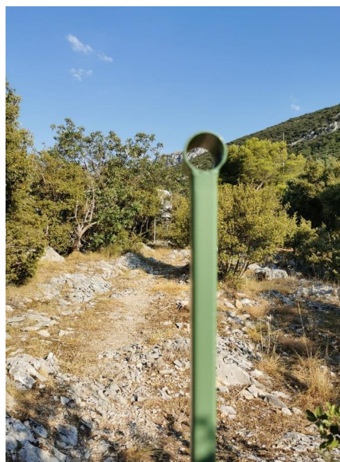
Targets that present connected localities