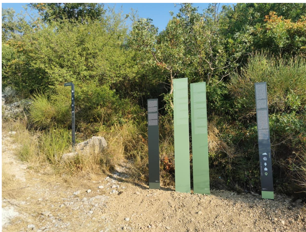
On site notice boards