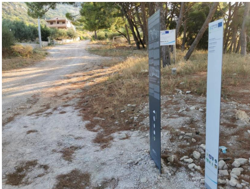
Beginning of the trail – project information