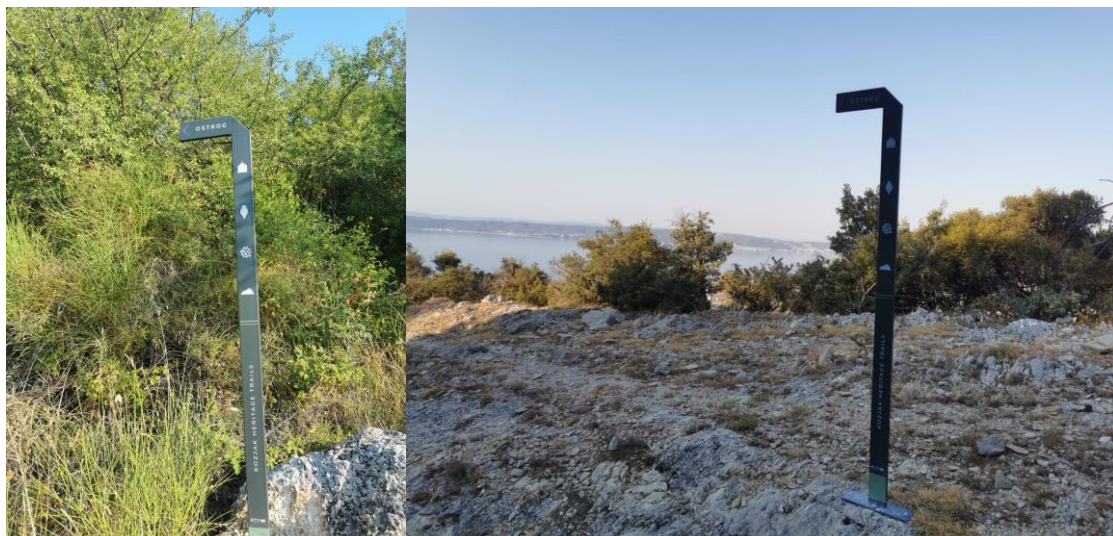
Guide signs 3 and 4