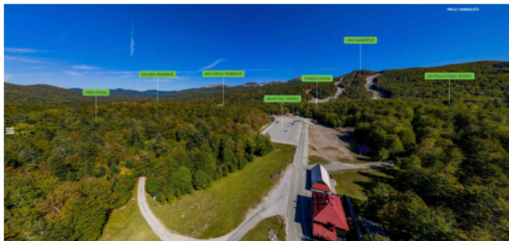
Interaktivna vizualna 360° šetnja Platkom

U sklopu EU projekta „EXCOVER“ koji se bavi uspostavom održivog turizma u ruralnim područjima, UO za regionalni razvoj, infrastrukturu i upravljanje projektima izradio je interaktivnu virtualnu 360° šetnju Platkom koja je integrirana na službenu web stranicu GSC-a https://platak.hr/ i u potpunosti funkcionalno dostupna široj javnosti.