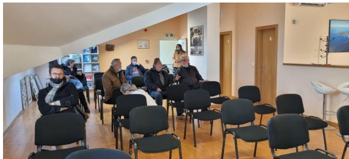
Photo of the event