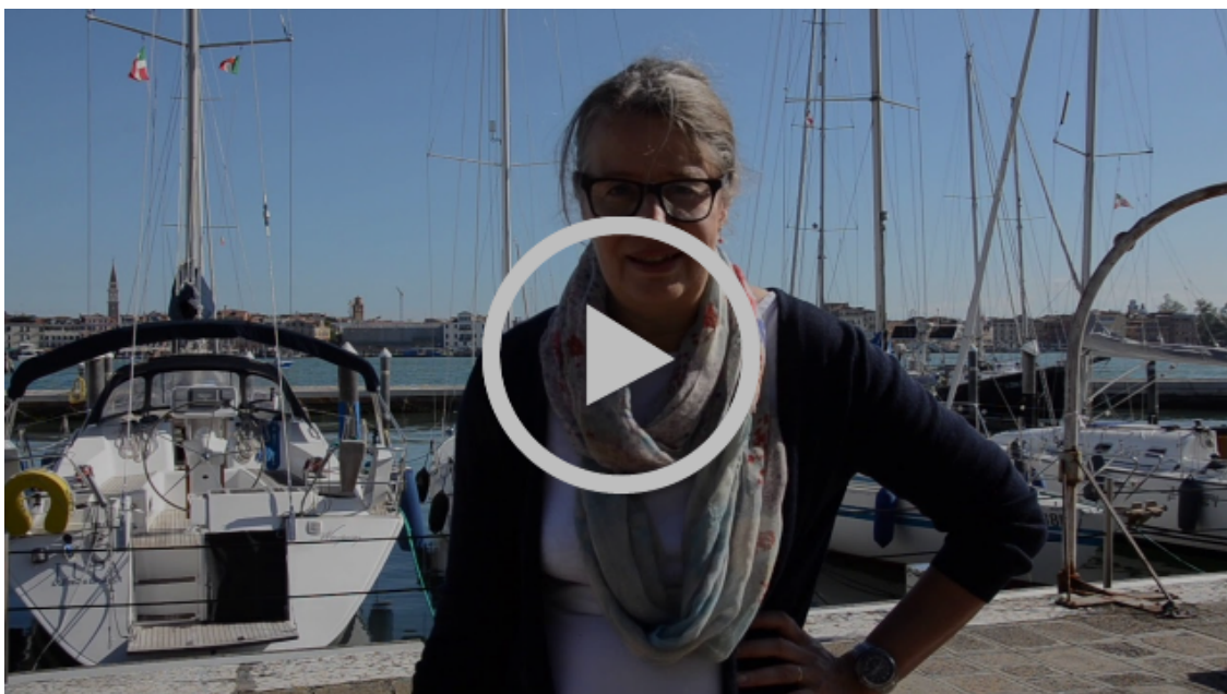
ADRIADAPT – predstavljanje projekta