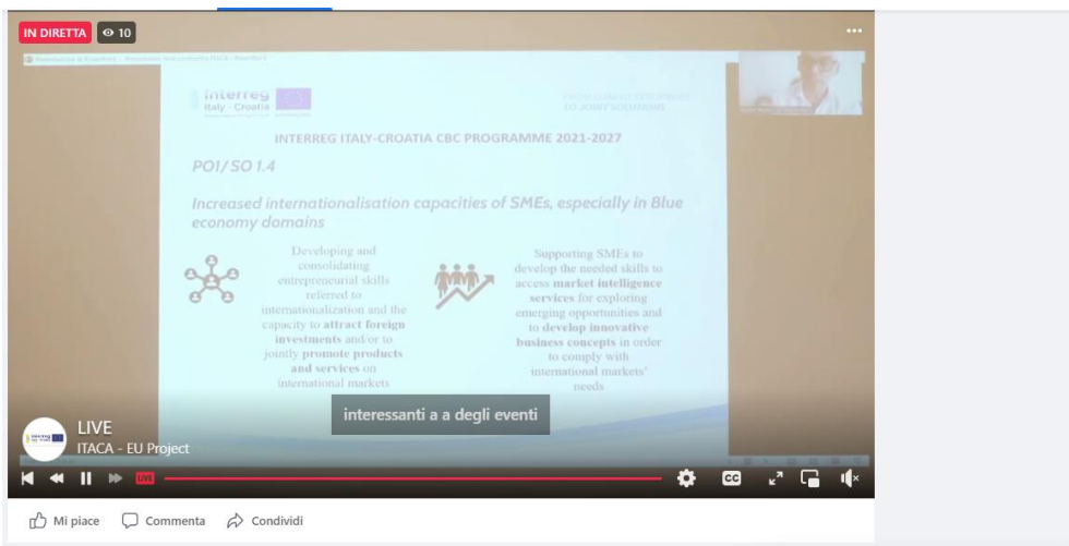
Screen dirette Facebook dell'evento finale