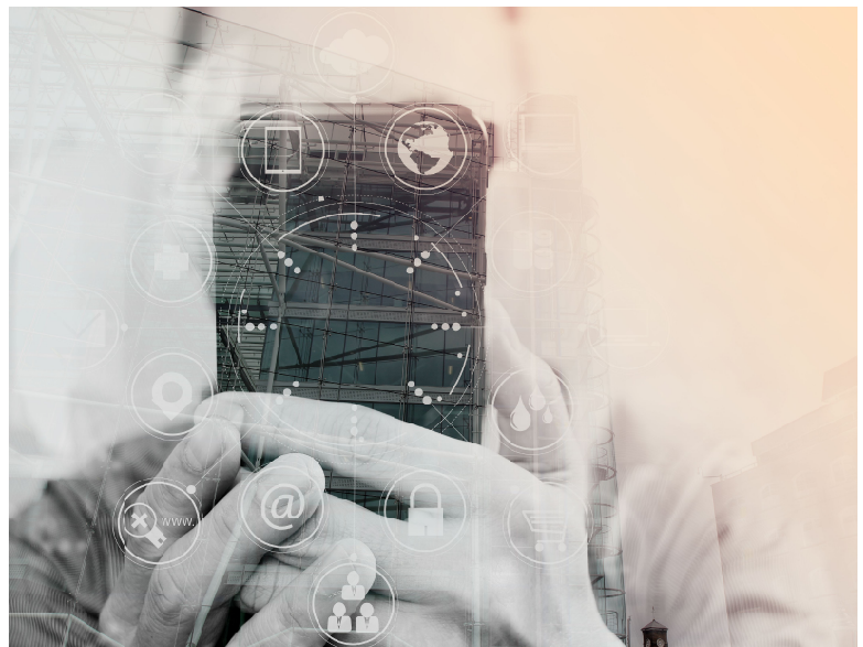
Immagine del progetto

Messaggio chiave I cittadini possono avere il ruolo di «sensori attivi» delle emergenze utilizzando correttamente i loro social media durante gli eventi