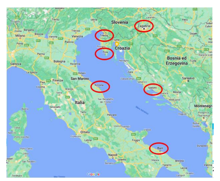
Figure 4 – identified "city hubs" within IT-HR Programme Area

In a nutshell, the cities chosen for the onfield awareness & sensitisation campaign were places where it has been possible to reach and engage a wide number of representatives of relevant stakeholders with territorial, administrative and/or managerial competences and experiences in the field of cross-border transport between Italy and Croatia. In other words, it was possible to maximise the impact of the ASC, disseminating the MIMOSA activities, pilot projects and results.