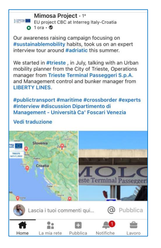
Figure 5: Examples of targeted communication activities for the ASC on social media

Targeted communication and dissemination activities have been fundamental throughout the campaign. All the MIMOSA project partners, and particularly the Partner responsible for communication, contributed to the dissemination and public awareness of each of the individual campaign steps. The widespread dissemination of the questionnaire in the different territorial areas it has been realized thanks to the publication on the different institutional websites of the partners, the massive mailing activity, and the use of the individual social media accounts in order to circulate the access link and the modalities/terms for filling in the questionnaire. Each stage of the on-field interviews and discussion groups in the different cities was supported by a specific storytelling via the MIMOSA social media accounts Figure 5 show a few examples of the AW-S campaign communication.