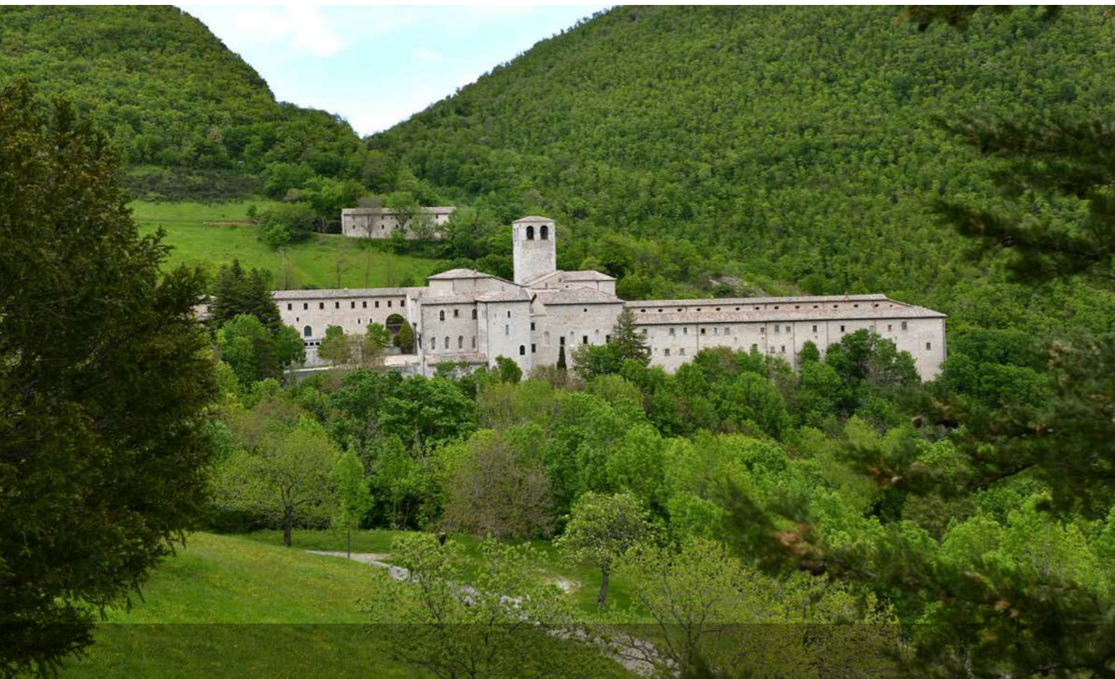
Monastero di Fonte Avellana

“Tu sarai un Cedro per la nobiltà della tua sincerità e della tua dignità; Biancospino per lo stimolo alla correzione e alla conversione; Mirto per la discreta sobrietà e temperanza; Olivo per la fecondità di opere di letizia, di pace e di misericordia; Abete per elevata meditazione e sapienza; Olmo per le opere di sostegno e pazienza; Bosso perché informato di umiltà e perseveranza.”