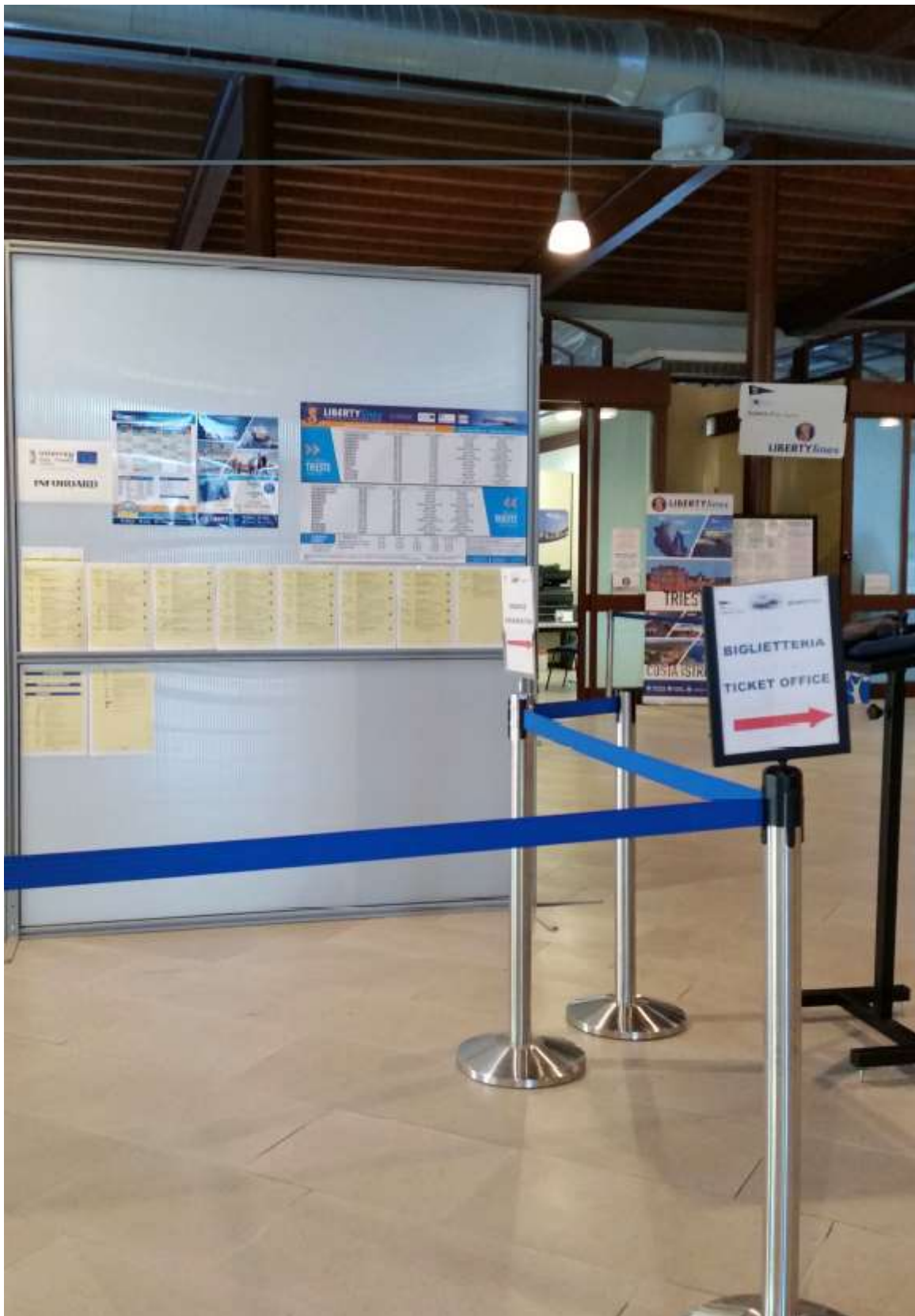
LP – Regione Autonoma Friuli Venezia Giulia; Nr. 1 Info-board installed in the Port of Trieste