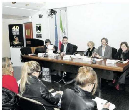
Un momento della presentazione del cartellone di Inteatro

contro tra i partner del progetto europeo "I-Archeo.S", finanziato dal programma interregionale Italia-Croazia e assegnato a Marche Teatro. Le frontiere, che alcune nazioni tendono anacronisticamente a rafforzare, qui da noi crollano, sulla scena! Non a caso, il tema "Identità e trasformazione" collega idealmente le performance, molte delle quali in prima italiana ed esclusiva, di artisti molto noti, come il greco Euripides Laskaridis, tra mitologia greca e trasformazioni metropolitane; Benjamin Verdonck, il poeta e drammaturgo che si confronta col pubblico; Gary Stevens, uno dei papà dei Teletubbies, che porta in scena i rapporti tra il singolo e la comunità; Alessandro Sciarroni, il talento marchigiano che con