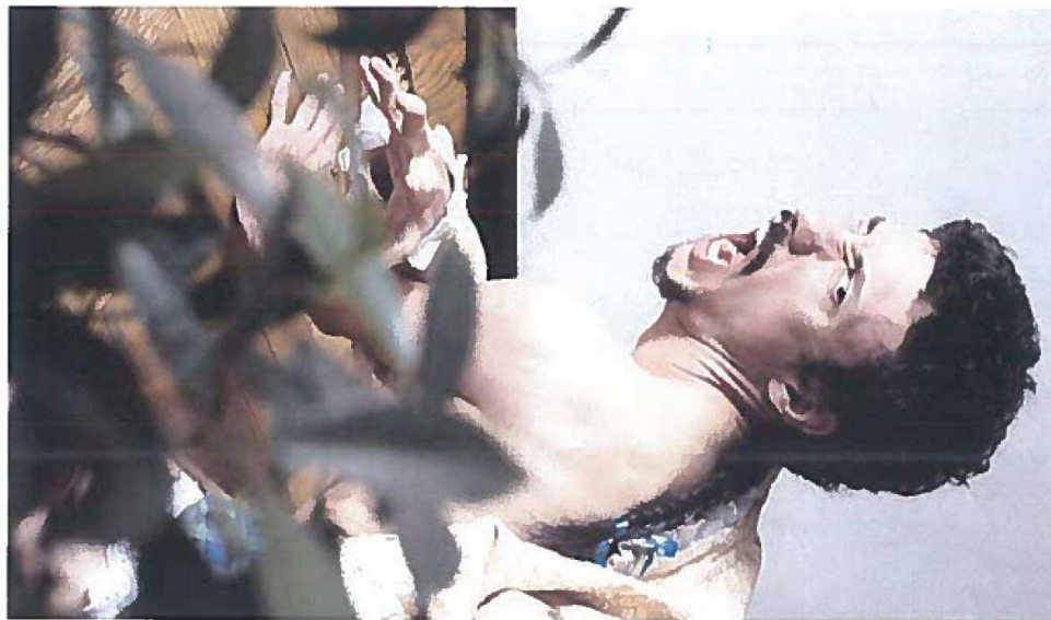
sopra: La camera du Roi di Andrea Costanzo Martini.

Due sono i progetti/network di cui Marche Teatro e Inteatro sono partner. « Crossing the sea è un progetto di internazionalizzazione dello spettacolo dal vivo con lo scopo di creare e consolidare collaborazioni di lungo termine tra Italia, Medio Oriente e Asia. Il progetto è realizzato col supporto del Ministero dei Beni e delle Attività Culturali all'interno del bando Boarding Pass Plus - spiega