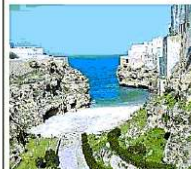
Lama Monachile a Polignano

dell'itinerario progettato verranno testati nell'educational tour programmato da oggi al 4 marzo. Tra le tappe conoscitive del percorso luoghi, prodotti enogastronomici, workshop, laboratori urbani, trulli, ceramiche e mostre. L'iniziativa è promossa dal Teatro pubblico pugliese e da Puglia Promozione che, in sinergia con la Fondazione Carnevale di Putignano, il museo Pino Pascali, il festival Libro Possibile e le Grotte di Castellana, hanno lavorato tutte insieme per rafforzare il sistema delle imprese creative e culturali in Puglia.