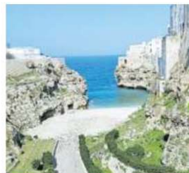
Lama Monachile a Polignano