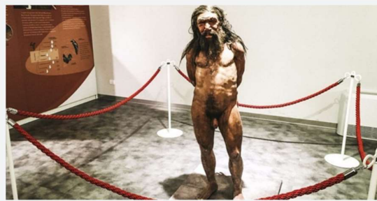
L'Uomo di Altamura.

ATTUALITÀ Altamura giovedì 25 ottobre 2018 di La Redazione