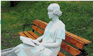
IL RITRATTO PIÙ VICINA A CESARE BRANDI CHE A FIORE, PARLÒ DELLA NOSTRA BELLEZZA