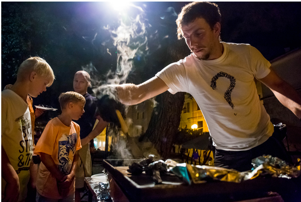
OKOLO – Tjedan kulture življenja u Poreču od 28. travnja do 5. svibnja

U Poreču se ovih dana vrijedno radi na pilot-projektu OKOLO – Tjedan kulture življenja koji će od 28. travnja do 5. svibnja okupirati brojne gradske lokacije. Uz bogat kulturni program za građane i goste, ovih je osam dana namijenjeno inozemnim i domaćim profesionalcima iz kulture i turizma u cilju bolje valorizacije baštine.