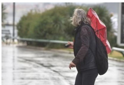
FOTO Jako jugo prouzročilo manju štetu na šibenskom području

( https://www.mgid.com/ghits/5988106/i/25399/0/src/1175484916/i/1175484916/midas-network.com/ContentArticle/IndexAsync/5911150?portalWidgetId=504&articleCampaignId=1&deviceTypeId=180601702&articleCampaignId=1&deviceTypeId=180601702 )