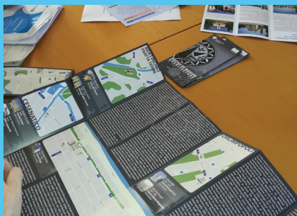
Un momento della formazione

L'approccio didattico utilizzato per la creazione dei prodotti turistico-culturali ATRIUM PLUS aventi ad oggetto questo particolare patrimonio scomodo, eredità del 20° secolo, è innovativo ed originale. La metodologia applicata si basa su: