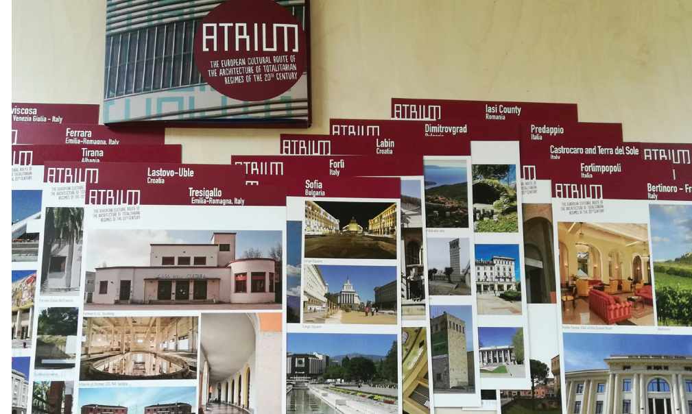
Brochure della Rotta Culturale del Consiglio d'Europa Atrium

Perciò la Rotta ATRIUM può offrire un contesto ideale entro cui promuovere viaggi d'istruzione per fare dei giovani turisti e cittadini consapevoli e responsabili.