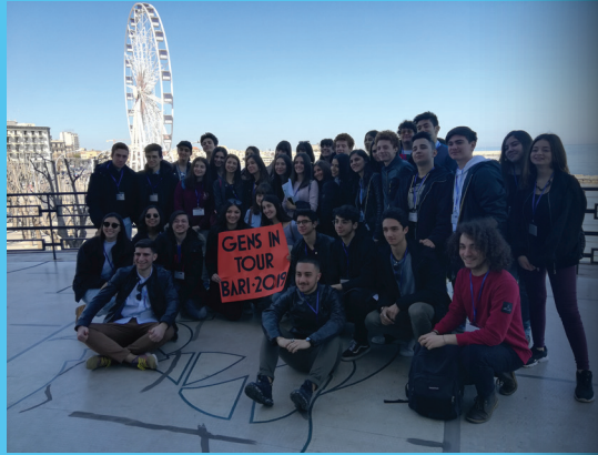
Viaggio d'istruzione pilota a Bari

In tale contesto il marchio ATRIUM GO! promuove 5 itinerari ATRIUM PLUS. Essi mostrano le architetture prodotte dai regimi non democratici europei del 20° secolo nel loro contesto politico originale, ma l'analisi si estende sul loro significato al tempo presente. E' proprio attraverso questo processo che emerge la dissonanza come una frattura fra il loro significato originale e i valori democratici di oggi.