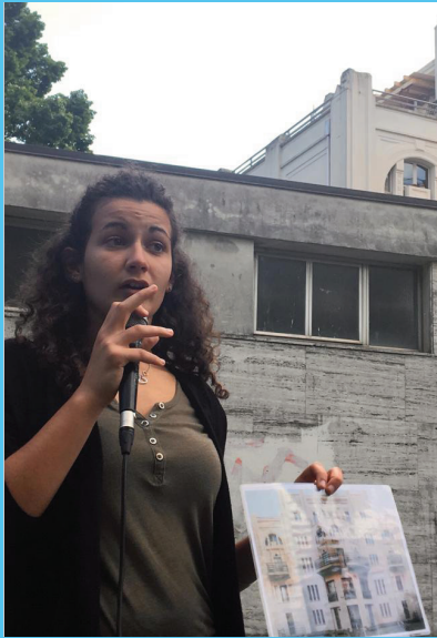
Prova locale a Ferrara

Una delle sfide affrontate da ATRIUM Plus è stata quella di progettare itinerari con il coinvolgimento attivo degli studenti, attraverso un apposito meccanismo di coapprendimento. Gli studenti, gli educatori ed i tutor hanno scelto, fra quelli censiti, gli edifici, i monumenti e gli spazi urbani che meglio rappresentavano l'impatto diretto del regime fascista e del sistema comunista sui paesaggi urbani.