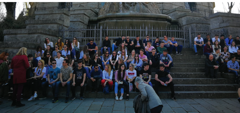
Viaggio d'istruzione pilota a Ferrara