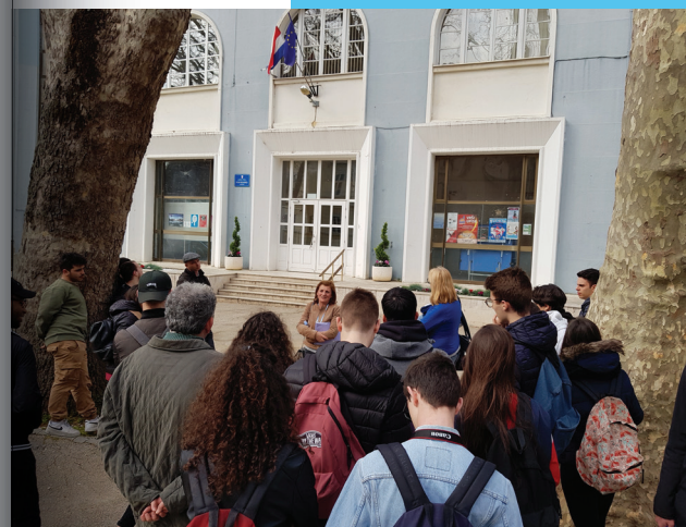
Viaggio d'istruzione pilota a Zara

"Ogni partner ha ospitato la scuola di un'altra città partner"