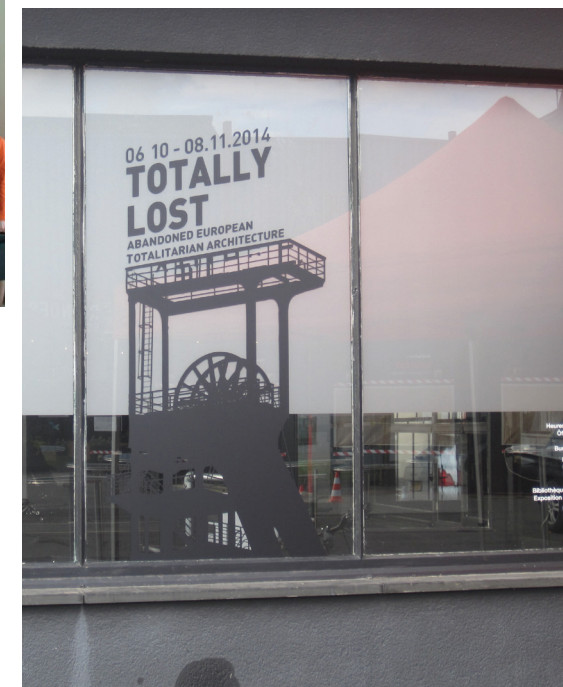
Mostra ATRIUM Totally Lost in Lussemburgo (2014)