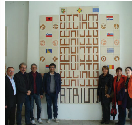
Generalna skupština i Upravni odbor u Dimitrovgradu, Bugarska (2014)