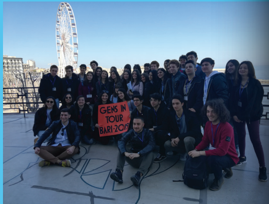
Pilot studijski posjet u Bariju

ATRIUM GO! je razvijen u suradnji s istraživačima, učenicima i nastavnicima, uz