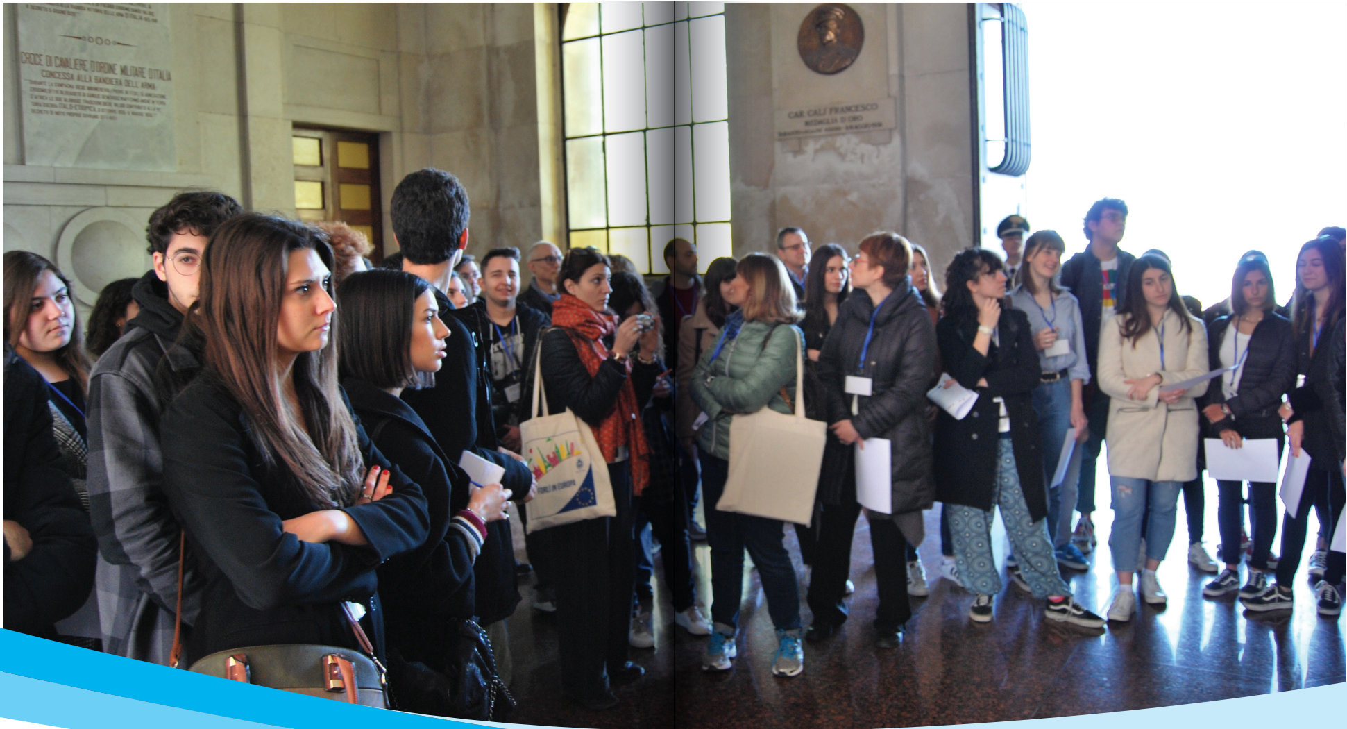
Pilot studijski posjet u Bariju