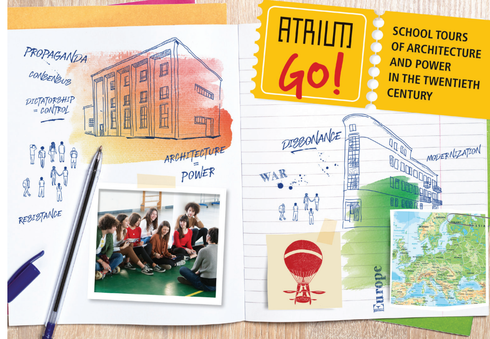
ATRIUM GO! konceptualna ploča

Tiskane su mape s pet letaka koji opisuju svaki itinerar, kao i pet razglednica itinerera s ciljem promoviranja ATRIUM GO! itinerera unutar škola i tour-operatora.