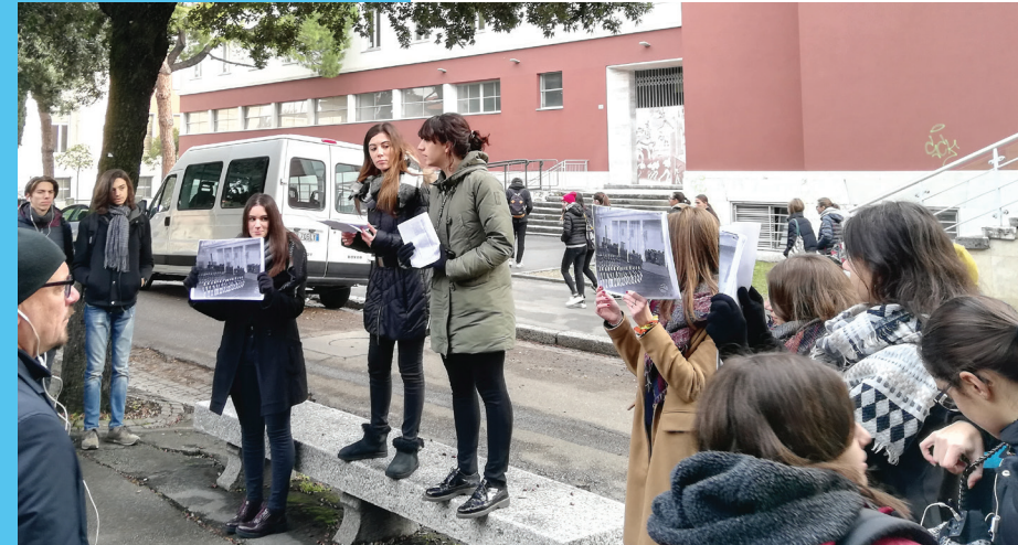
Lokalno testiranje u Forliju

Zahvaljujući procesu obuke i učenja, učenici su aktivno pridonijeli prepoznavanju kakav bi itinerer trebao biti kako bi bio privlačan drugim školarcima, na primjer, predlažući upotrebu audio zapisa, slika, pripovijedanja kratkih priča kako bi se povećala praktična i iskustvena dimenzija posjete.