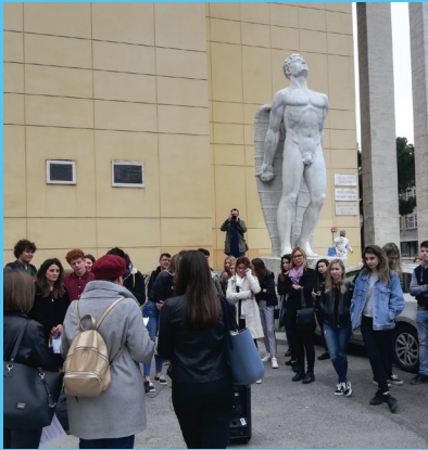
Pilot studijski posjet u Forliju

ATRIUM GO! je ... brand edukacijskih školskih izleta za učenike srednjih škola, osmišljen u sklopu projekta ATRIUM PLUS, s ciljem povećanja turističke ponude ATRIUM RUTE.