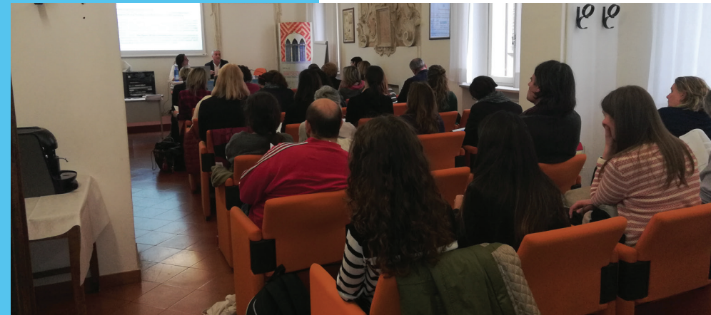
Tečaj obuke u Forliju

organiziran kako bi sudionici mogli reagirati na predavanja kao i poticati raspravu i razmjenu mišljenja među svim sazvanim sudionicima.