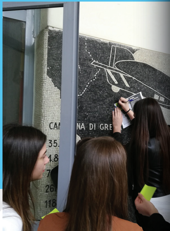
Lokalno testiranje u Forli