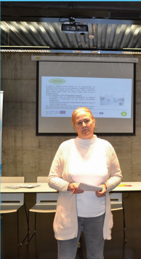
Tečaj obuke u Labinu

Kao rezultat obuke izrađen je priručnik alata koji osigurava diseminaciju „ATRIUM metodologije“.