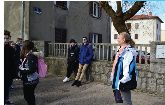
Lokalno testiranje u Labinu