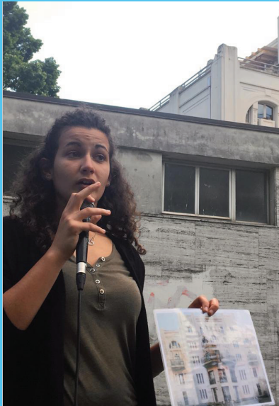
Lokalno testiranje u Ferrari

Jedan od izazova s kojim se ATRIUM Plus suočio bio je oblikovanje itinerera s aktivnim sudjelovanjem učenika, pomoću ad-hoc mehanizma zajedničkog učenja. Polazeći od arhitektonskog istraživanja, učenici, nastavnici i mentori odabrali su arhitekture, spomenike, urbana područja koja predstavljaju izravan utjecaj fašističkog režima i komunističkog sustava na urbane krajolike.