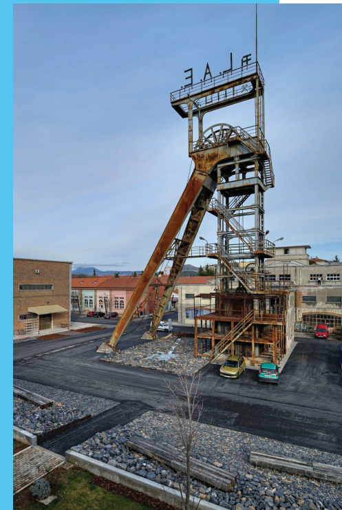
Labin - Šoht

Svi su podaci korišteni za izradu plana ruta i oblikovanje načina njihovog pripovijedanja temeljenog na ključu disonance koji tumače i na raspolaganju su za daljnji razvoj.