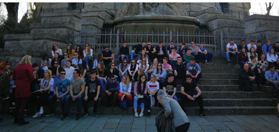
Viaggio d'istruzione pilota a Ferrara