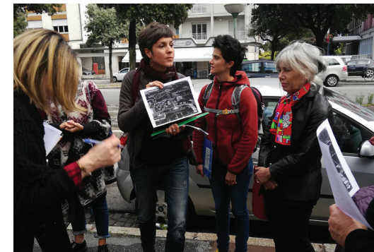
Lokalno testiranje u Forliju

Kao rezultat obuke, izrađen je priručnik alata koji bi osigurao širenje „ATRIUM metodologije“, između ostalog i među članovima ATRIUM rute. Alat je dostupan na web stranici programa www.italy-croatia.eu