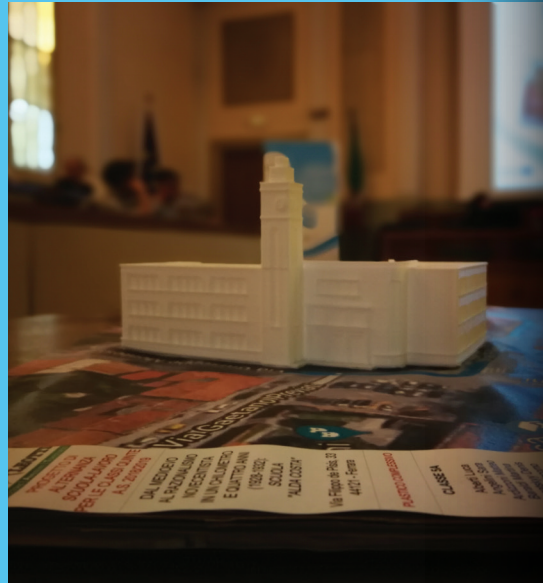
Lokalno testiranje u Ferrari

Zgrade, mjesta i njihova povijest vezana na činjenice kako su ih režimi koristili za postizanje konsenzusa bili su osnova za oblikovanje pripovijesti o ATRIUM PLUS itinererima. Interaktivne radionice korištene su kako bi učenici bolje razumjeli pojam disonance, te kako bi razumijevanje istog upotrijebili u osmišljavanju itinerera.