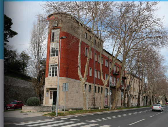
Zadar - Pellicettijeve kuće

Pregledano je 45 lokaliteta arhitektonske baštine i njihovi podaci o znanstvenim, estetskim, povijesnim i umjetničkim vrijednostima, te stupnju prezentacije